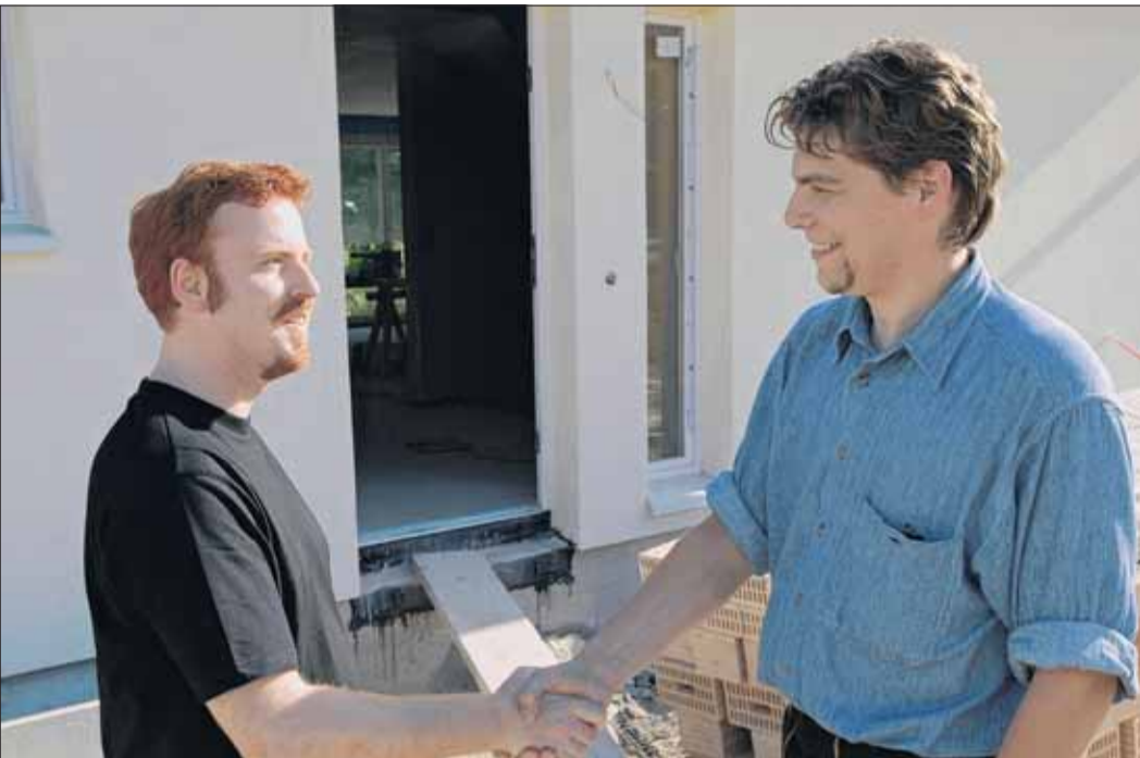
Auf gute Zusammenarbeit: Mit Handwerksprofis, die auf hochwertige Produkte und Verarbeitung setzen, ist der Bauherr auf der sicheren Seite und legt den Grundstein für ein Haus, das nachhaltig seinen Wert behält.