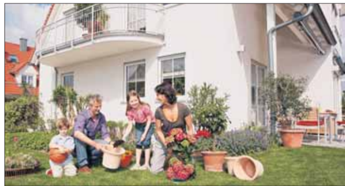
Wohnbehagen, Wohngesundheit und hohen Marktwert gewährleisten vor allem massiv aus Mauerwerk und Beton errichtete Häuser.